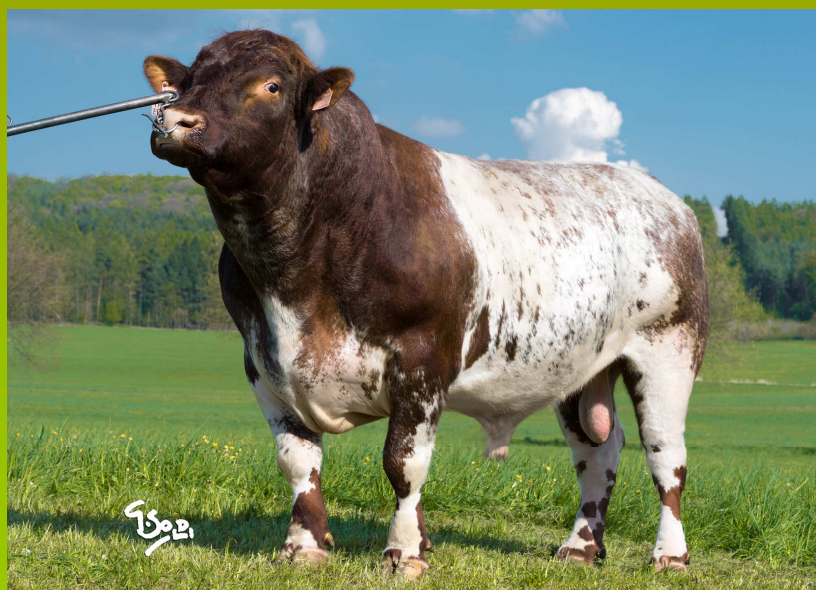
TAROK P ZSH 005